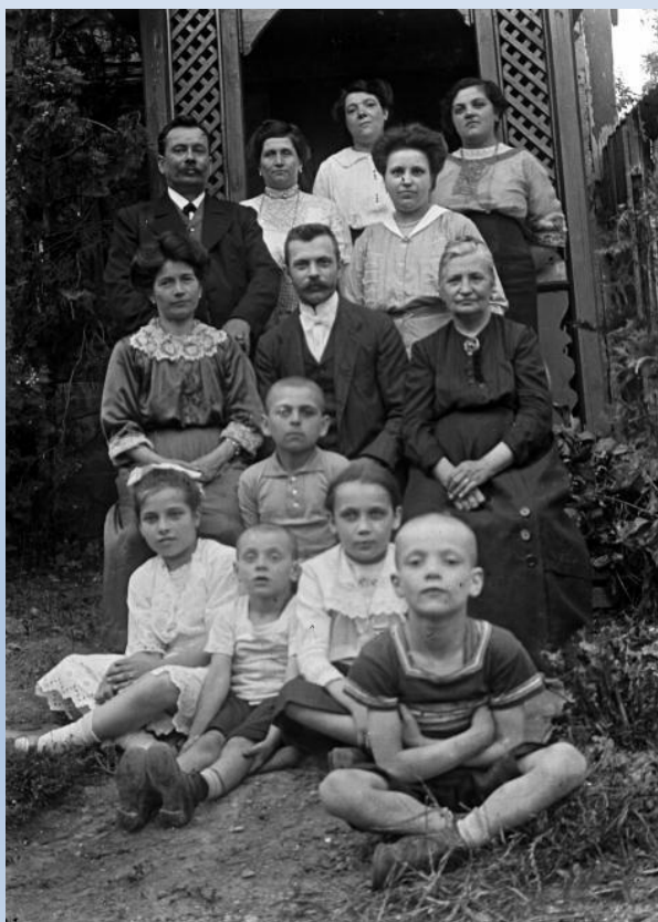
Családi fotó 1905-ből