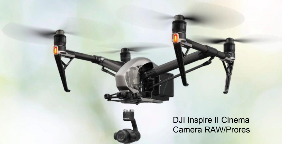
DJI Inspire II Cinema Camera RAW/Prores