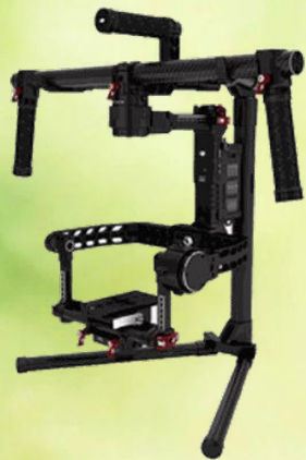
DJI Ronin M stabilizator