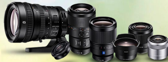
Sony Alpha III + R II + objektív park