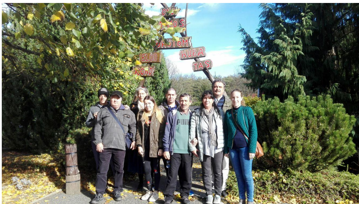
A délután kőszegi városnézéssel folytatódott.